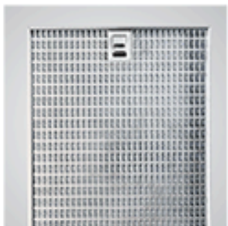
Filtres inox pro